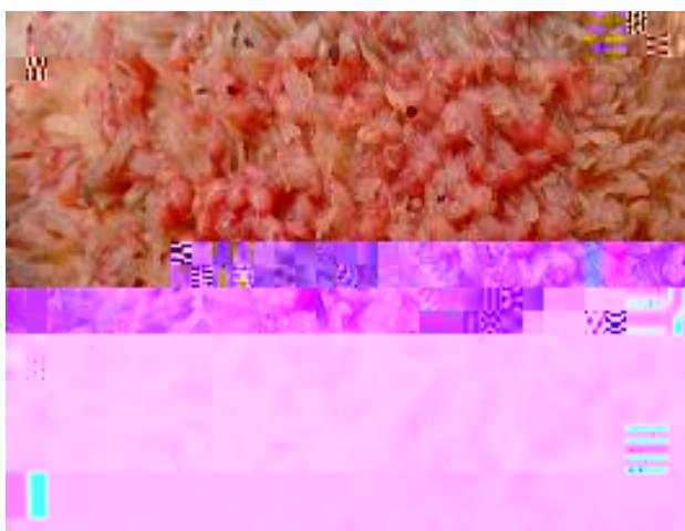
#86A>4/ f i " t z' / s t i t z ž f i t z' / s t i t z ž f i R P T V O G P C H U I G G R